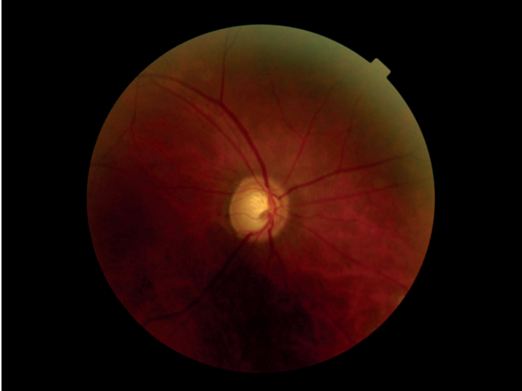
Figura 2. Retinografía color: los discos ópticos se aprecian excavados con alteración del ISNT. Poros visibles de lámina cribrosa mayormente en el ojo izquierdo. E/D 0.8