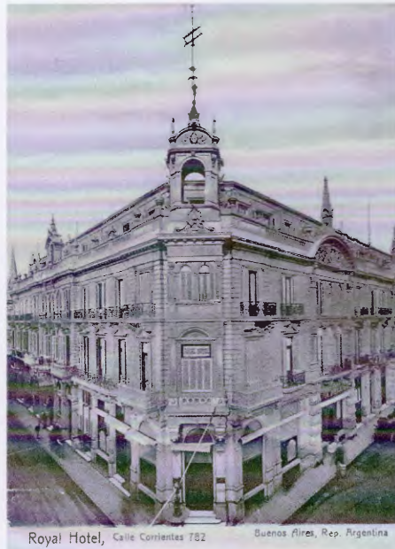
Figura 9. Postal del Royal Hotel de Buenos Aires.

Desconocemos durante cuánto tiempo el general Caballero permaneció en forma ininterrumpida en nuestro país, pero Caras y Caretas (número del 8 de agosto de 1908) informó sobre su exitoso regreso al Paraguay. No obstante, en 1911 la revista volvió a comunicar que era uno de los tantos “emigrados” a nuestro país (número del 22 de abril de 1911), nuevamente con motivo de otro golpe de estado. Final-