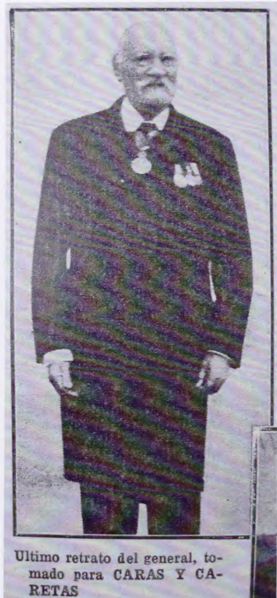
Figura 3. El general Caballero luciendo sus condecoraciones (1911).

El Pueblo, La Nación y La Prensa , con el propósito de comprender los sucesos políticos acaecidos en la República del Paraguay, lo cual se complementó con la lectura de la enciclopedia Historia de América: América contemporánea de Ricardo Levene y colaboradores. Para conocer los detalles de los últimos días de la vida del ex presidente Domingo Faustino Sarmiento consultamos Sarmiento y su época (volumen 2 [de 1863 a 1888], de José S. Campobassi, Buenos Aires: Editorial Losada, 1975), Recuerdos literarios (Buenos Aires: La Cultura Argentina, 1915) y Confidencias literarias (Buenos Aires: Casa Editora Argos, 1893), ambas obras del embajador Martín García Mérou. Para indagar sobre la técnica quirúrgica empleada por el Dr. Lagleyze recurrimos a Anales de la Universidad de Buenos Aires (1889), Revista de la Universidad de Buenos Aires (1911), Archives d'Ophthalmologie (1894), Annales d'Oculistique (1913), Ophthalmologia Ibero-Americana (1952) y a la colección System of Ophthalmology , de Sir Stewart Duke Elder (Londres: Henry Kimpton, 1969). Con el fin de recabar datos sobre el Dr. Juan