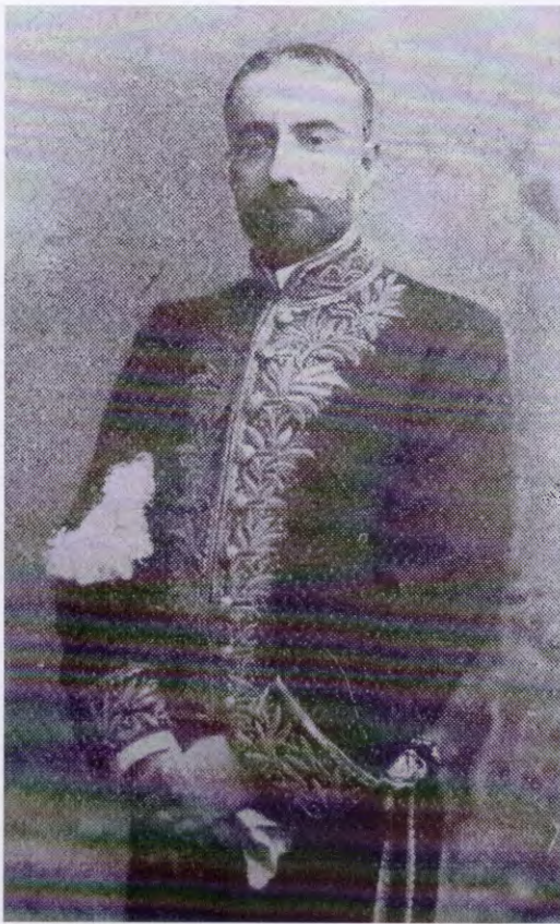
Figura 6. El embajador Martín García Mérou (obituario, 1905).

Asunción, con motivo de los últimos sucesos políticos y por razones de salud, se halla en Buenos Aires el general Bernardino Caballero, á quien operará en breve el doctor Lagleize de una dolorosa afección á la vista. Le acompañan su hijo [...].”