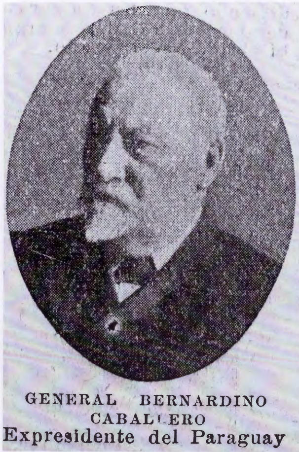
Figura 2. El general Bernardino Caballero (1902).

El Pueblo, La Nación y La Prensa , con el propósito de comprender los sucesos políticos acaecidos en la República del Paraguay, lo cual se complementó con la lectura de la enciclopedia Historia de América: América contemporánea de Ricardo Levene y colaboradores. Para conocer los detalles de los últimos días de la vida del ex presidente Domingo Faustino Sarmiento consultamos Sarmiento y su época (volumen 2 [de 1863 a 1888], de José S. Campobassi, Buenos Aires: Editorial Losada, 1975), Recuerdos literarios (Buenos Aires: La Cultura Argentina, 1915) y Confidencias literarias (Buenos Aires: Casa Editora Argos, 1893), ambas obras del embajador Martín García Mérou. Para indagar sobre la técnica quirúrgica empleada por el Dr. Lagleyze recurrimos a Anales de la Universidad de Buenos Aires (1889), Revista de la Universidad de Buenos Aires (1911), Archives d'Ophthalmologie (1894), Annales d'Oculistique (1913), Ophthalmologia Ibero-Americana (1952) y a la colección System of Ophthalmology , de Sir Stewart Duke Elder (Londres: Henry Kimpton, 1969). Con el fin de recabar datos sobre el Dr. Juan