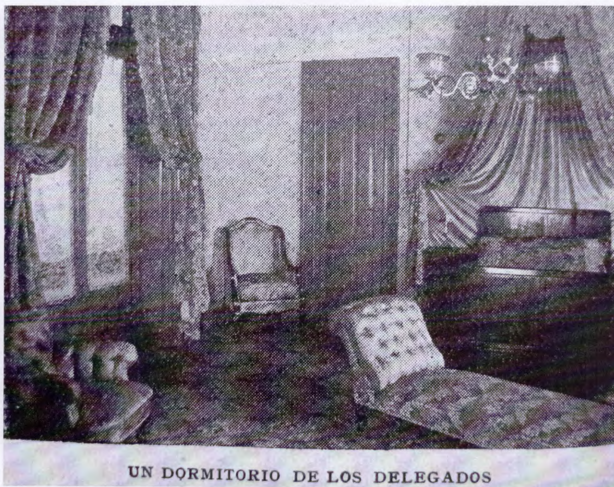
Figura 10. Una habitación del Royal Hotel (1903).