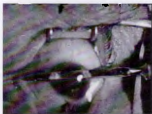
Figura 4. Realización de una incisión corneal con el cuchillete de Graefe.

guay, equivalentes a los boletines oficiales de nuestro tiempo.