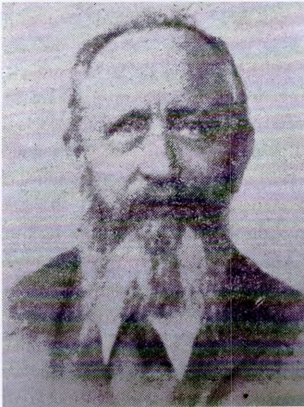
Figura 8. El Dr. Francisco Morra 23 .

informaba Caras y Caretas (con retraso, el 1º de marzo). Ambos periódicos de Buenos Aires informaron sobre su arribo acontecido el 21 de febrero y su alojamiento en el Royal Hotel. Asimismo, ambos diarios, en sus secciones de noticias sociales del 25 de febrero, difundieron que “Lagleize practicó ayer con felicidad una operación al general Bernardino Caballero” ( La Nación ) y que “el General Caballero sufrió ayer con toda felicidad una operación en la vista. Con este motivo numerosas personas pasaron por su alojamiento para informarse de su estado” ( La Prensa ). Es decir, la cirugía del primer ojo fue realizada el lunes 24 de febrero de 1902 y no el 25, como lo afirmaba Caras y Caretas . Del texto de la noticia del semanario se infiere que el segundo ojo (el de la foto) fue intervenido el sábado 8 de febrero de 1902.