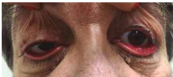
Figura 4. Paciente masculino de IMC mayor de 30 con hiperlaxitud palpebral, ectropión y conjuntivitis papilar crónica.