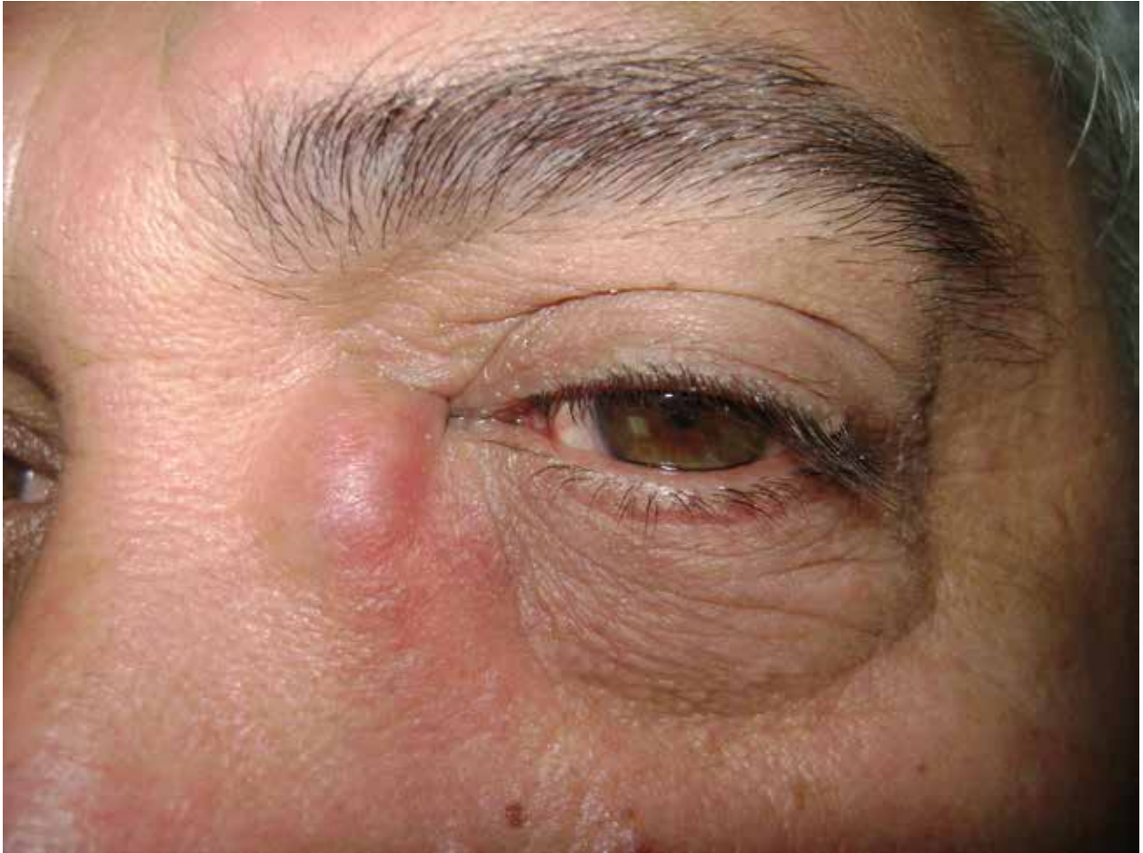
Figura 1. Se observó una masa palpable grande a nivel del canto medial izquierdo, con desplazamiento del globo ocular hacia temporal superior.

y falta de lleno del saco lagrimal sin eliminación del contraste (fig. 2). Se realizó tomografía computada cortes axiales y coronales, sin contraste y resonancia magnética (figs. y 4) respectivamente, donde se puede apreciar una masa de partes blandas y densidad homogénea, morfología ovoidea, bordes bien definidos y contornos regulares. Dicha lesión mide 23 mm en sentido céfalo-caudal, 16 mm en sentido transversal y 24 mm en sentido antero-posterior, situada en la región inferomedial orbitaria, en contacto con