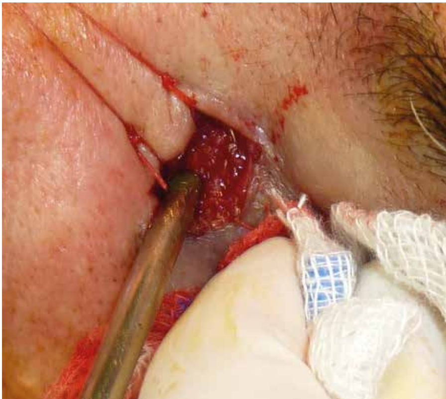
Figura 5. Se realizó una dacriocistectomía parcial con fines diagnósticos.