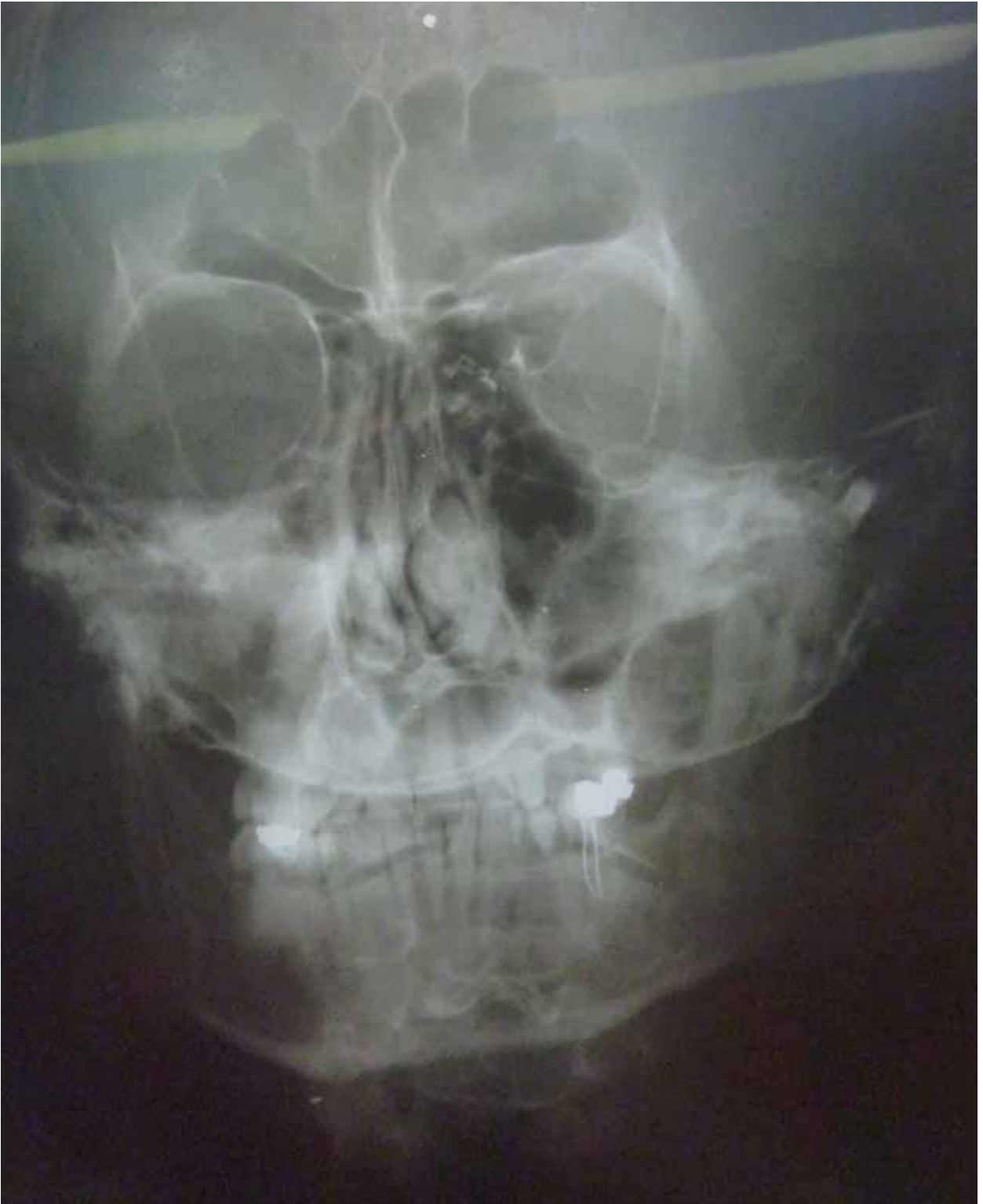
Figura 2. Se observó distensión y falta de lleno del saco lagrimal sin eliminación del contraste.