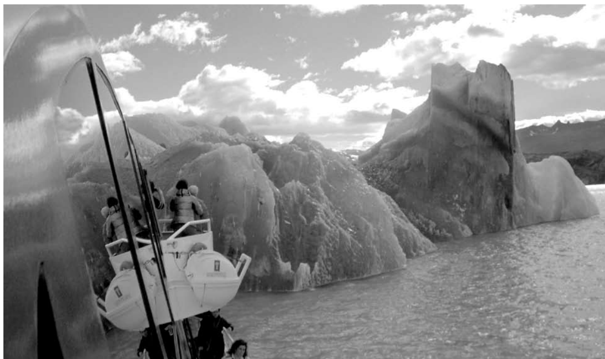
Glaciar Upsala - Suecia